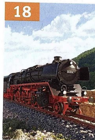
BR 45: exklusives Clubmodell