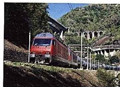
125 Jahre Gotthard

Gottardo, Krokodil und Ae 8/14: Viele Legenden sind am Gotthard zuhause.