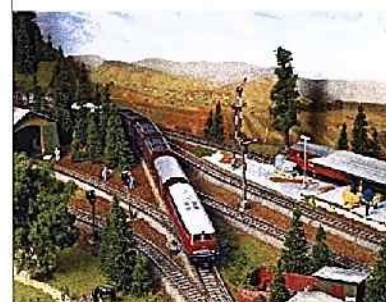
HERZSTÜCK Die kompakte H0-Anlage erhält ihr Herzstück: die Bahnhofsplatte.