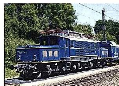
SCHIEBEDIENST Auf der Spessartrampe hilft eine ÖBB 1020 den Güterzügen über die Steigung.